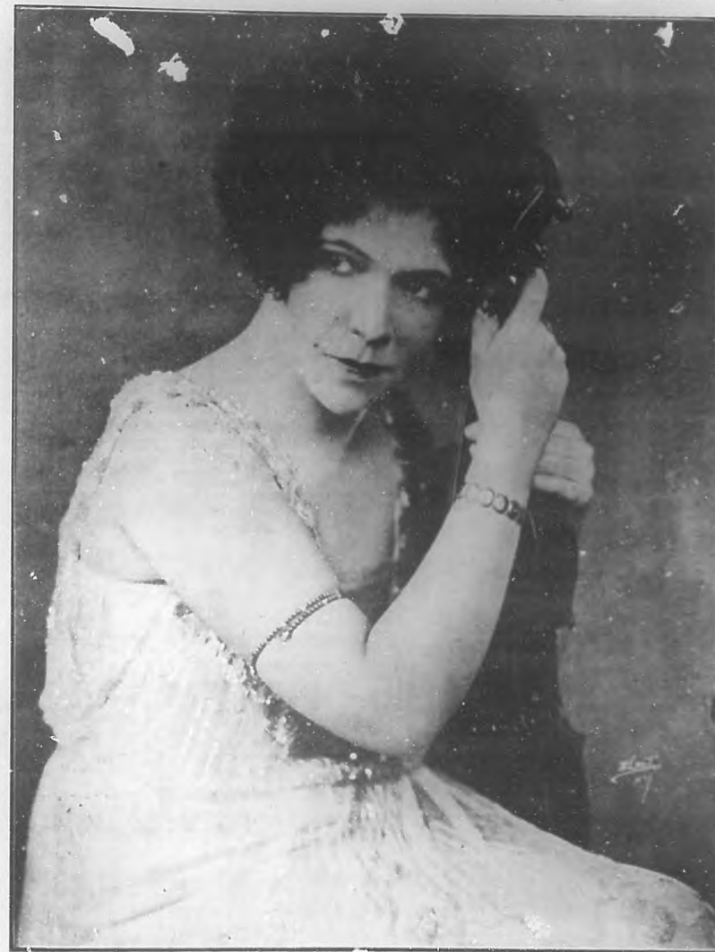
MARTA DE LA TORRE

El mago de la guitarra: Segovia. En el Nacional, la noche del martes 10 se despidió de nosotros el incomparable artista granadino, con un recital en cuyo programa había números de Schubert, Albeniz, Chopin, Schuman, Haydn