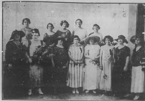
Un grupo de delegadas al Primer Congreso Nacional de Mujeres, efectuado recientemente en esta ciudad.

de artistas. Todos nuestros intelectuales: dibujantes, pintores, literatos, periodistas, etc., desde el más alto al más modesto charlaron y comieron en franca camaradería.