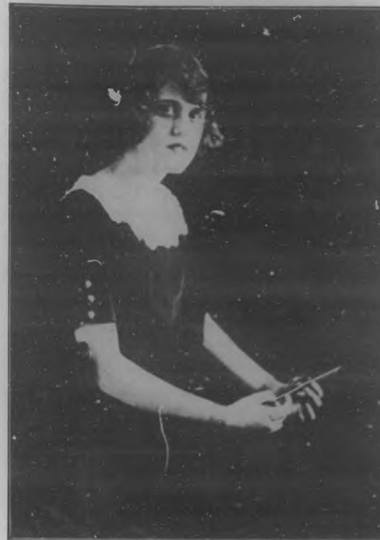
La juventud, la inteligencia y la más exquisita belleza son dones que adornan a esta distinguida damita, gala de la sociedad habanera y alumna eminente del Instituto de Segunda Enseñanza.