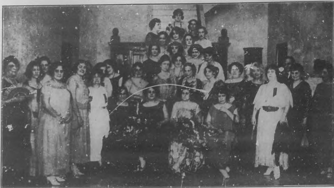
Las delegadas de toda la República.

Las madres cubanas estamos de enhorabuena. Nuestras hijas y nietas tienen abierto un porvenir más halagüeño que el nuestro.