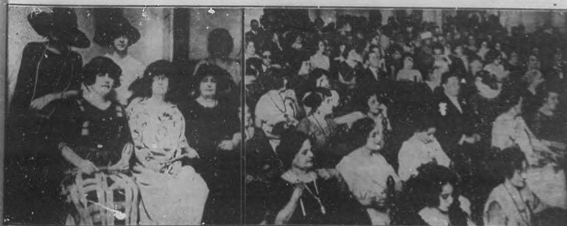
Dos aspectos de las damas concurrentes a la sesión celebrada en la Academia de Ciencias.