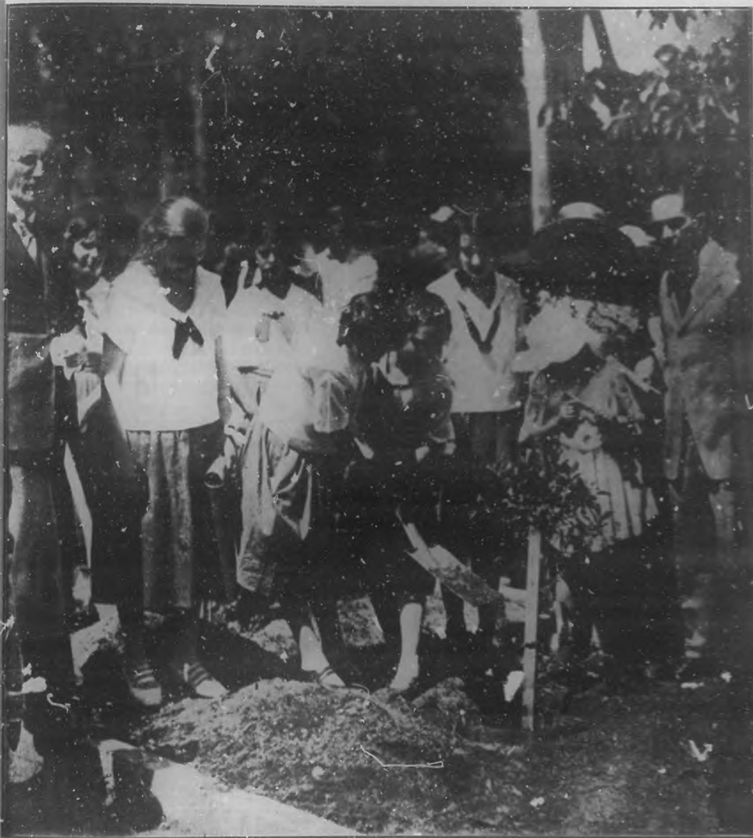
LA FIESTA DEL ARBOL Y DEL PAJARO

Redacción, Adminis- tración y Talleres Gráficos de BOHE- MIA, Trocadero nú- mero 80, 90 y 92— Teléfono: Dirección M-1022; Administra- ción, A-558.