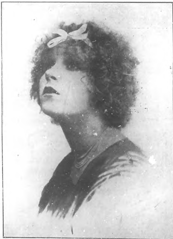
LA MARAVILLITA ARGENTINA Bella y notable cancionista argentina que está alcanzando ruidosos triunfos en "Martí".

El notable y popular primer actor que ha llevado una vez más su compañía al teatro "Payret".