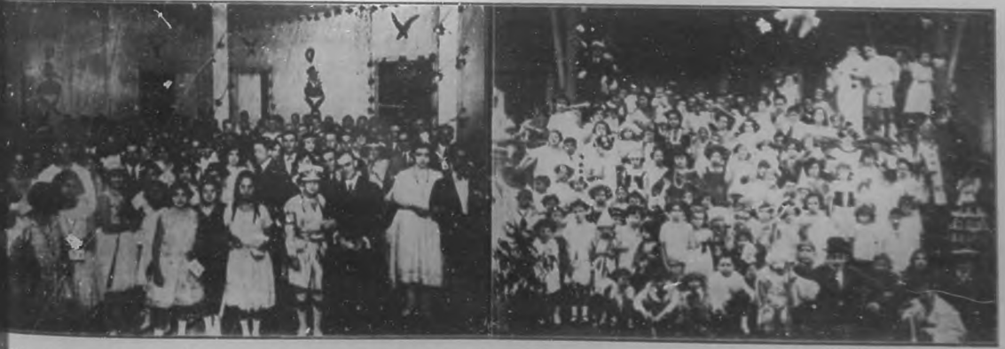
Niños concurrentes al baile de inauguración del "Club Chaparra" en la noche del diecisiete del pasado mes.