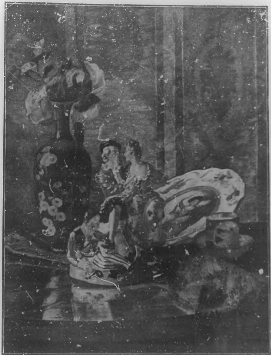
NATURALEZA MUERTA Cuadro de Josef Schufter.