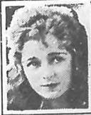
ANITA STEWART Famosa Estrella del Cine.

La mayoría de los jabones y shampús compuestos contienen demasiado álcali, substancia esta muy perjudicial, puesto que deseca el cuero cabelludo y hace frágil el cabello. No hay nada mejor para la limpieza del cabello, que puro aceite de coco Mulsified porque es puro y abso-