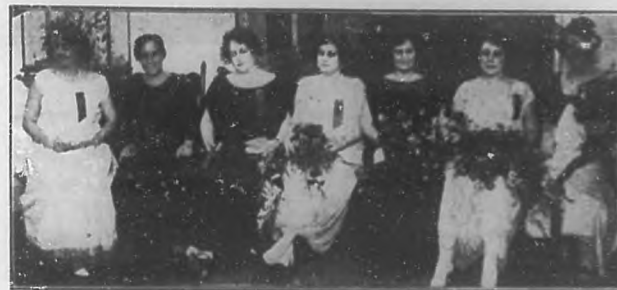
Grupo de distinguidas congresistas en la Academia de Ciencias.